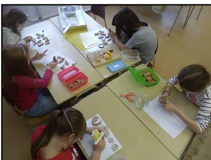
Děti z družiny pečou a zdobí perníčky