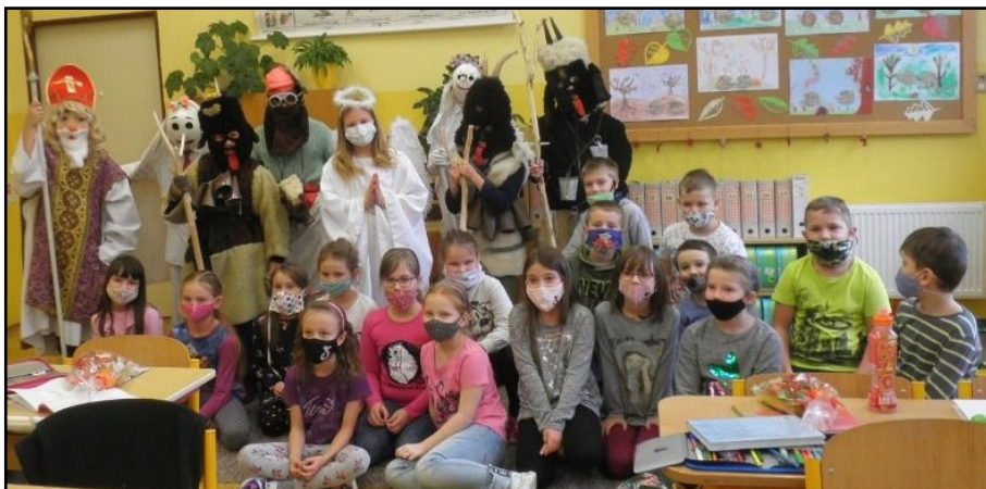
Mikulášská nadílka na naší škole